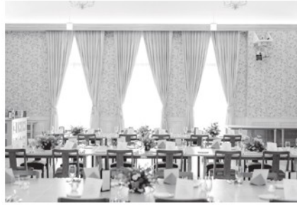
「街なかウェディング」ができるオワンブルー山形