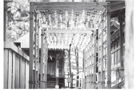
東北の伊勢 熊野大社参拝