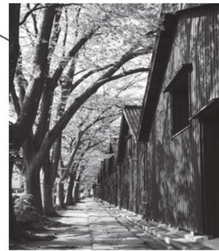
米どころ庄内のシンボル「山居倉庫」